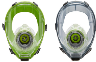
Vollmasken BLS 5400 - BLS 5150