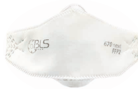
BLS 670ne»xt Größe M/L - Size S