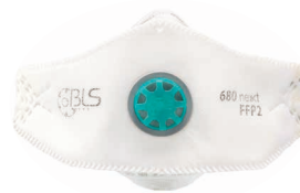
BLS 680ne»xt Größe M/L - Size S